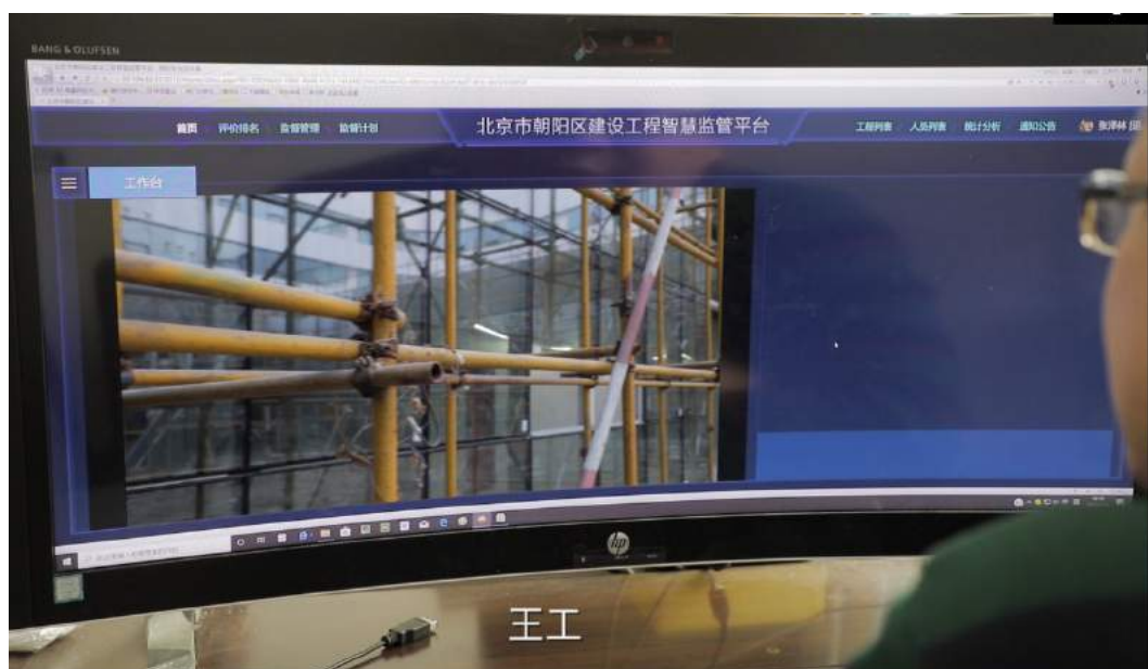
监管人员在办公室就能看到现场实时传输的画面，真正实现：“远程监管”