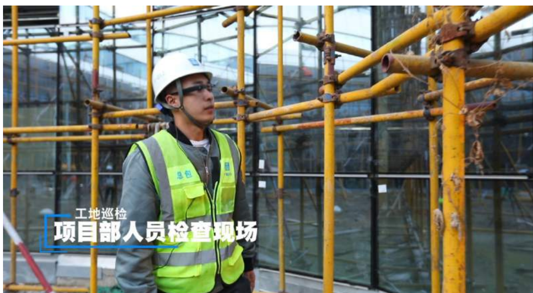
项目部人员（施工或监理单位人员）佩戴上建科研“智能眼镜”

1、远程实施监管：项目部人员（施工或监理单位人员）佩戴上建科研“智能眼镜”，监管人员在办公室远程查看现场情况，可以和现场人员语音互动，针对发现的问题可以随时截图通过 APP 发给现场人员，和亲自去现场监督检查效果相当。